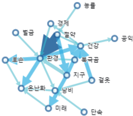
[찬성의견 네트워크 분석]