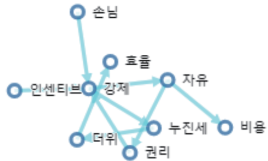
[반대의견 네트워크 분석]